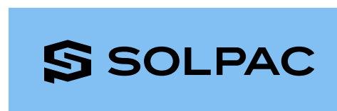
ライトブルー+SOLPACブラック