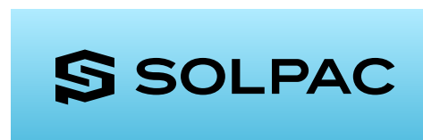
ブルー系のグラデーション+SOLPACブラック