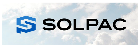
明度の高い画像+フルカラー