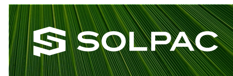
明度の低い画像+ホワイト